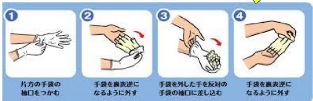
1 片方の手袋の袖口をつかむ